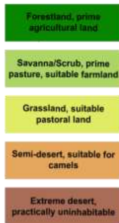
Africa, Present Day

Άριστη γη για καλλιέργειες Άριστη γη για κτηνοτροφία / Κατάλληλη για καλλιέργειες Κατάλληλη γη για κτηνοτροφία Ημέρημος γη κατάλληλη για εκτροφή καμήλας Έρημος πρακτικά μη κατοικήσιμη