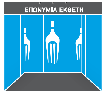
Με επικάλυψη βινυλίου