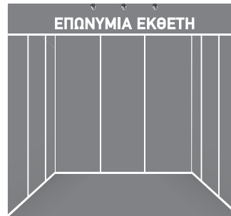
Χωρίς επικάλυψη βινυλίου