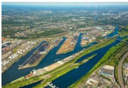
Το λιμάνι του Duisburg

Duisburg-Essen φοιτούν τη στιγμή αυτή περισσότεροι από 2.000 Κινέζοι φοιτητές, οι περισσότεροι στο Τμήμα Μηχανικών. Μέχρι τώρα οι Κινέζοι φοιτητές επέστρεφαν στη χώρα τους μετά το πέρας των σπουδών τους, κάτι που θα μπορούσε να αλλάξει με τη γενικότερη μεταβολή του αστικού τοπίου της πόλης.