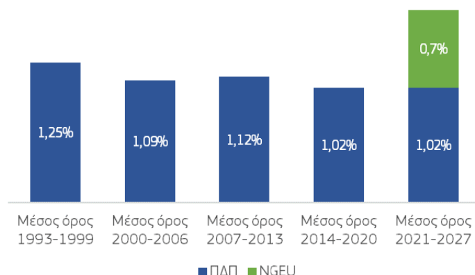
Εικόνα 2. Ο προϋπολογισμός της ΕΕ ως ποσοστό του ΑΕΕ 38

Ο τρέχων προϋπολογισμός διαθέτει επίσης ορισμένες ενσωματωμένες δυνατότητες δημοσιονομικής ευελιξίας, αλλά η κλίμακά τους είναι περιορισμένη και συχνά είναι δύσκαμπτες ως προς τη χρήση τους. Ειδικά μέσα πέραν των ανώτατων ορίων δαπανών μπορούν να συμβάλουν στην κάλυψη απρόβλεπτων αναγκών. Ορισμένα προγράμματα διαθέτουν ενσωματωμένες δυνατότητες ευελιξίας ή αποθεματικά 39 . Συνολικά, οι διαθέσιμες δυνατότητες ευελιξίας ανέρχονταν στο 3,65 % των συνολικών ανώτατων ορίων όταν εγκρίθηκε το πολυετές δημοσιονομικό πλαίσιο 40 . Κατά την ενδιάμεση αναθεώρηση του δημοσιονομικού πλαισίου, οι δυνατότητες ευελιξίας στον προϋπολογισμό της ΕΕ είχαν ήδη εξαντληθεί λόγω του μεγέθους των κλυδωνισμών που κλήθηκαν να αντιμετωπίσουν, πρωτίστως των επιπτώσεων του πολέμου της Ρωσίας κατά της Ουκρανίας, αλλά και των φυσικών καταστροφών στην ΕΕ και πέραν αυτής: η ετήσια κατανομή του μηχανισμού ευελιξίας και του αποθεματικού αλληλεγγύης και επείγουσας βοήθειας είχε κινητοποιηθεί πλήρως κατά την περίοδο 2021-2022: το 79 % του αποθεματικού αναδυόμενων προκλήσεων και προτεραιοτήτων και το 75 % των αδιάθετων περιθωρίων για ολόκληρη την περίοδο είχαν διατεθεί. Ως εκ τούτου, ο μηχανισμός ευελιξίας και το αποθεματικό αλληλεγγύης και επείγουσας βοήθειας χρειάστηκε να ενισχυθούν, ενώ δημιουργήθηκαν και δύο νέα μέσα, το μέσο EURI και το αποθεματικό για την Ουκρανία, για την αντιμετώπιση απρόβλεπτων αναγκών.